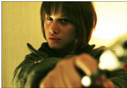
Una escena del filme '25 kilates', de Patxi Amezcua.

Cine italiano en el CAC. El Centro de Arte Contemporáneo de Málaga (CAC Málaga) acoge, dentro de su ci-