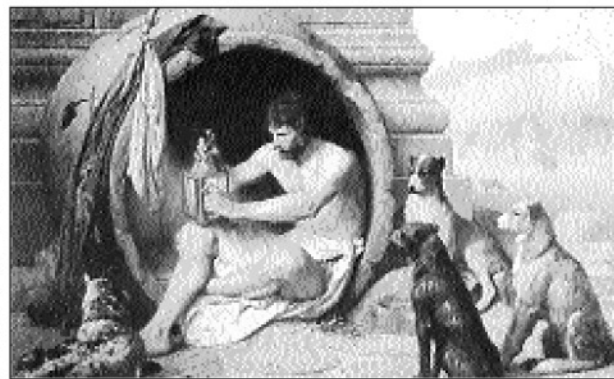
Diógenes, icono del retiro.

sedantes. Quizá nuestro entorno sea un oficio de tinieblas, y sólo cuando apagamos la luz (esa luz externa y mentirosa) descubrimos el artificio y sentimos el impulso de llorar, de emprenderla a golpes contra la Gran Impostura. Apenas arañamos la superficie de las cosas, salta su pintura cochambrosa