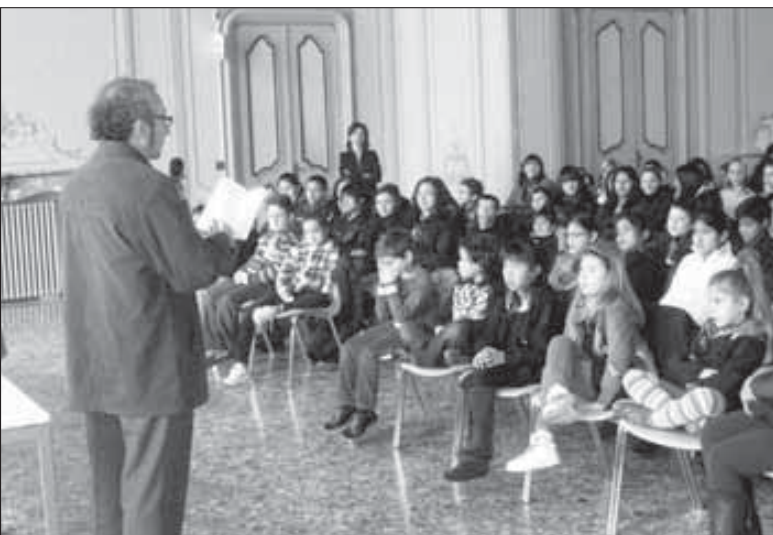
El poeta Mario Campaña dando una charla a los niños ecuatorianos residentes en Génova.

Porque con la poesía no se puede hacer negocios. La sociedad moderna vive para el lucro, y últimamente, y especialmente en América Latina, del lucro a cualquier precio: un principio de una vileza evidente, puesto que ponen facultades más altas, capaces de logros mayores al servicio de metas restrin-