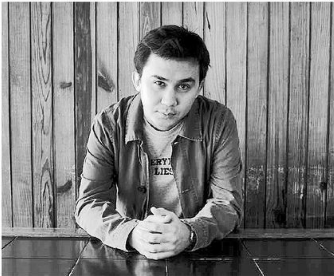
Gabriel Payares representa en sus cuentos "el desencanto y la desesperanza como devenires predecibles de la vida"

de la caída que zanja cualquier intento de construcción; de la vida animal que pulula debajo de la piel de lo visible, esa realidad escondida donde se alían las especies abisales, donde los monstruos celebran sus orgías, donde lo animal ladra e irrumpe, donde la sangre funda estirpes imprevistas que habitan la casa por debajo, por las raíces podridas del afecto. Este libro nos hace recorrer un paisaje hecho de escombros, de objetos a la deriva, oxidados, putrefactos, insertados; habitado por restos y sombras que están allí para mostrar su inutilidad y, a la vez, para revelar la potencia de sentido que se esconde detrás de su vencimiento y destrucción. Seres y cosas que sobreviven a duras penas; que se mantienen a flote en las aguas de un río que "nos había arrastrado hacia el