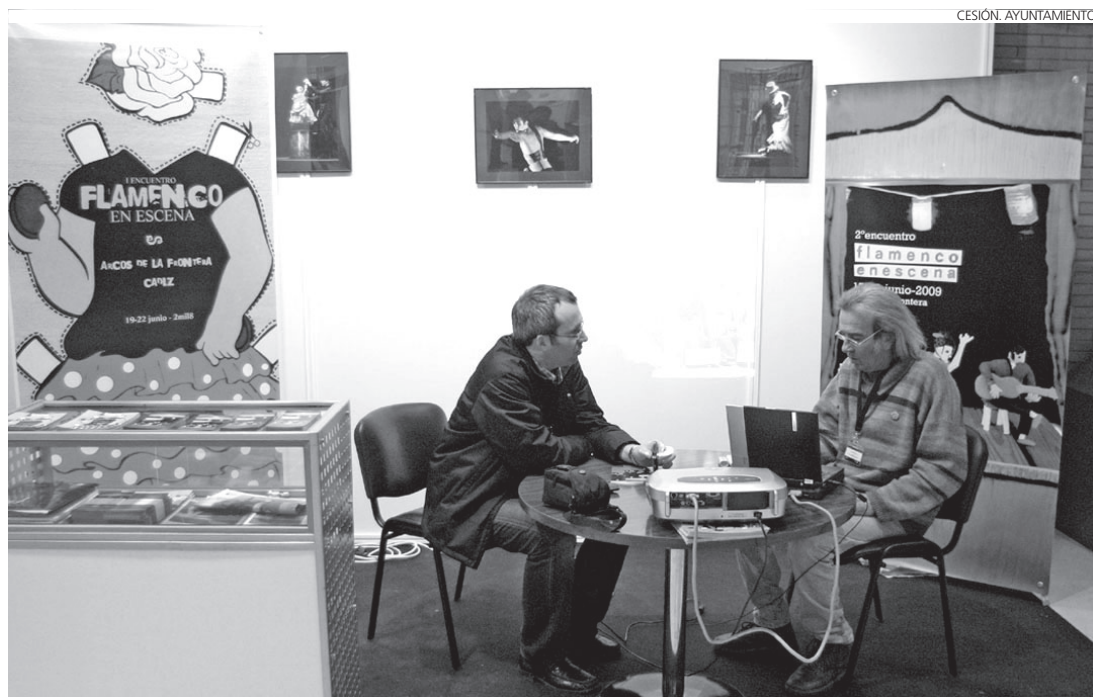
La Agencia Andaluza para el Desarrollo del Flamenco cedió un espacio al II encuentro Flamenco en escena.

FERIA La muestra se celebró en Sevilla del 5 al 7 de marzo