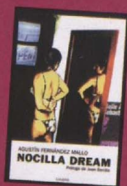
NOCILLA DREAM Candaya

"LORCA ME PARECE INSOPORTABLE TANTO COMO POETA COMO POR SU BIOGRAFÍA"