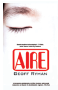
Aire Geoff Ryman La Factoría

La Habitación de Ámbar es uno de los mayores tesoros creados por el hombre. Las tropas alemanas que invadieron la Unión Soviética se hicieron con ella en 1941. Cuando los Aliados comenzaron los bombardeos fue ocultada y se convirtió en un misterio que perdura hasta nuestros días. A la juez Rachel Cutler le encantan su trabajo y sus hijos, y mantiene una relación civilizada con su ex marido Paul. Todo cambia cuando su padre muere en misteriosas circunstancias, dejando pistas acerca de un secreto llamado «la Habitación de Ámbar». Desesperada por descubrir la verdad, Rachel viaja a Alemania seguida de cerca por Paul. Enfrentados a asesinos profesionales en un juego traicionero, los dos chocan contra las fuerzas de la avaricia, el poder y la misma Historia.