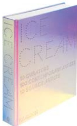
Ice Cream Phaidon

Más que una novela, Nocilla Dream es el principio de muchas novelas hábilmente ensambladas con material documental y propio en una sólida e inesperada docuficción, que opta por la descripción directa de acontecimientos mínimos y le debe mucho a proyectos vanguardistas como el de París de Walter Benjamín (donde seguramente, ya en los años treinta, se inventa el zapping literario). En Nocilla dream , una de las apuestas narrativas más arriesgadas de los últimos años, proliferan las referencias al cine independiente norteamericano, a la historia del collage, al arte conceptual, a la arquitectura pragmática, a la evolución de los PCs y a la decadencia de la novela.