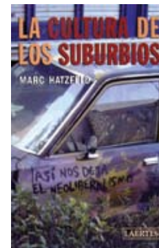
La cultura de los suburbios Marc Hatzfeld Laertes Editorial

El pueblo de Mae es el último en conectarse a la red. Pero ahora hay algo nuevo, algo que no necesita conexiones ni ordenadores: es Aire . Aire es una nueva tecnología de comunicación que pone los beneficios de Internet al alcance de todos y en todas partes, lo quieran o no. Nada puede pararlo. Mae es analfabeta, pero sabe que Aire lo cambiará todo. ¿La escuchará su gente antes de que sea demasiado tarde? Geoff Ryman publicó en 1984 'El país irredento', obra con la que ganó los premios World Fantasy y British SF; este último galardón le sería concedido de nuevo tres años más tarde por 'Love Sickness'. Desde entonces ha obtenido numerosos reconocimientos, que le han convertido en una referencia mundial de la ciencia ficción.