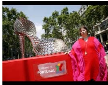
Portugal se promociona como destino turístico con un enorme zapato de Cenicienta