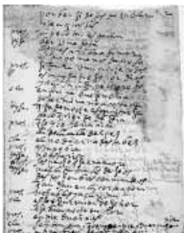
►► El manuscrito que ayer vio la luz pública consta de 56 folios.

Quizá en un arranque de entusiasmo, el propio Lope de Vega no dudó en presumir de haber escrito alrededor de 1.500 comedias. A pesar de la reconocida productividad del Monstruo de la Naturaleza del teatro español, los estudiosos, bastante más prudentes que el autor, han identificado algo más de 300 comedias indudablemente de su autoría; hasta 400 contando con las de atribución dudosa, más algo más de una veintena de las que solo se conoce su existencia, una