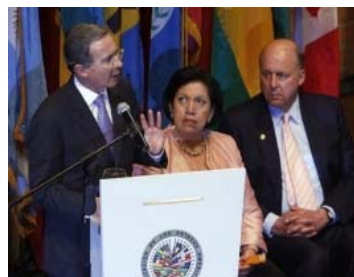
La crisis entre Ecuador y Colombia en la inauguración de la asamblea de la OEA -