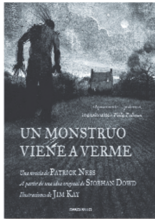
UN MONSTRUO VIENE A VERME Patrick Ness DeBolsillo

Porque Galarza usa el humor con inteligencia, huye del barroquismo y de las situaciones falsamente dramáticas con hábil finura. Sabe contar historias con pocos trazos y construir personajes que son más de lo que cuentan. Esencial y directo, permite que esta historia crezca en cada página con su carga de melancolía, esperanza e ironía.