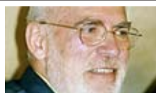
Víctor Mora AUTOR DE LOS GUIONES DE ‘EL CAPITÁN TRUENO’ Y ‘EL JABATO’

“Creo que ‘El Jabato’ puede aportar hoy lo mismo que antaño”