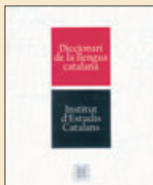
DICCIONARI DE LA LLENGUA CATALANA Institut d'Estudis Catalans. 67 €

Doce años después de la primera edición, el Institut d'Estudis Catalans muestra cómo ha puesto al día el diccionario normativo, el que sirve para determinar qué es ortodoxo en catalán. Con una sobrecubierta que recuerda el diccionario de la RAE (quizá para reforzar subliminalmente la autoridad lingüística que emana de él), su novedad más importante es una reestructuración general del contenido de las entradas, con una tipografía más rica y visible que permite consultarlo con más comodidad (las acepciones y subacepciones aparecen numeradas, y las locuciones en negrita). Destaca también la admisión de nuevas entradas (más de dos mil: lifting, estatinidenc, xarria ) de acuerdo con el uso actual, y la revisión de ejemplos. Un interrogante: ¿veremos fijada algún día la fonética de las palabras? RICARD FITÉ